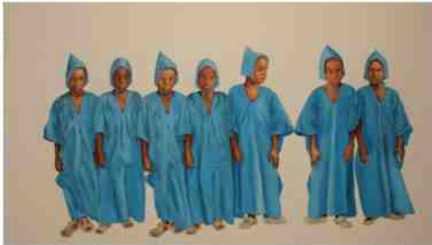
Nirveda Allecks Ölgemälde „Continuum Mali“ misst 2,50 Meter in der Breite. Es ist zu sehen in der Ausstellung „11Focus“ parallel zur Art Basel.

Afrika hat bildmächtige Künstler, die der hiesige Kunstbetrieb meist ausspart. Bis Sonntag bietet „Focus11“ in Basel einen faszinierenden Überblick auf aufstrebende und etablierte Künstler des schwarzen Kontinents.