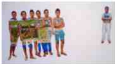
Nirveda Alleck: „Continuum Chagos“ von 2010 im Ausschnitt.

Kleine Jungs, alle in blauen Kapuzenmänteln, schauen den Betrachter an. Realistisch, in lebhaften Farben gemalt, stehen die Figuren auf nichts als der großen weißen Leinwand. Handelt es sich um ein religiöses oder um ein politisches Ritual? Die nächsten Gemälde geben Aufschluss.