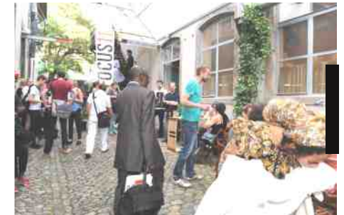
FOCUS11 attracted more than 3000 visitors from 15th to 19th of June 2011.

“We feel that the standard has once again been raised in many respects. As a result more and more people have shown interest in the show and its accompanying events. Since the first edition in 2009 we have managed to build up the show year for year, offering a good basis to explore possibilities for another edition in 2012.”