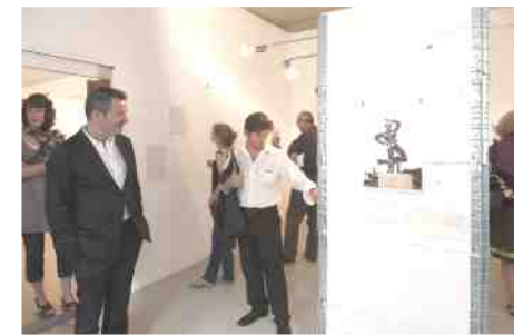
Presentation of Dou'art on the second floor of FOCUS11.