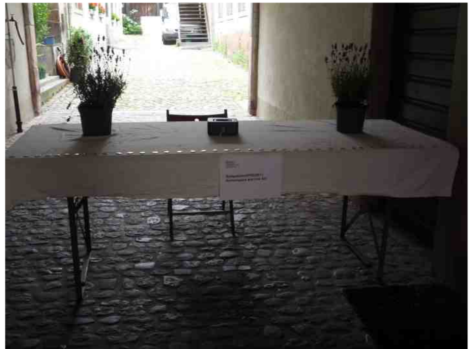
FOCUS attracted a lot of professionals and provided an exclusive opportunity for networking.