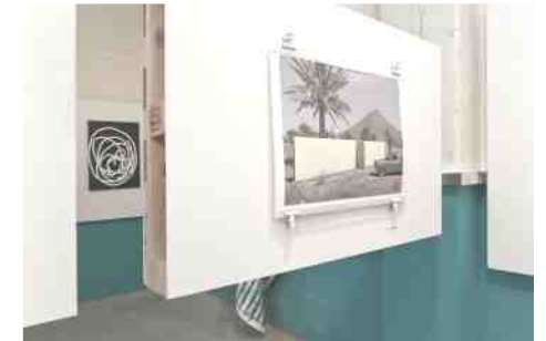
Graeme Williams: Phutanang Township, Kimberly (2011) (right). Jan-Henri Booyens: Black Flag (2011) (left).